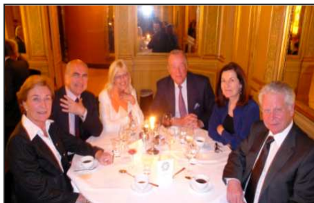
NOTRE DELEGATION FRANCOPHONE !