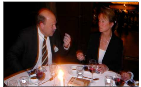
LE PRESIDENT LEHARI &amp; LA MINISTRE DE LA CULTURE LIJEROTH