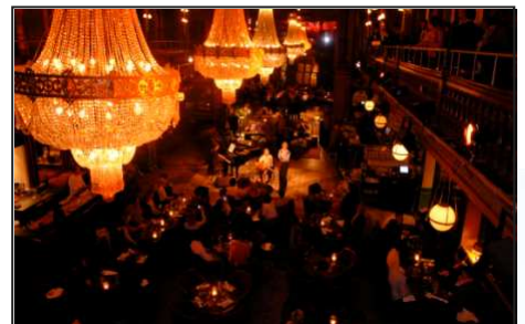
CONCERT DANS « THE BERNSSALONGER »