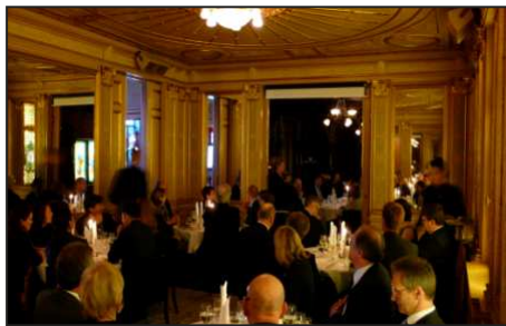
DISCOURS DE Mme LENALILJEROTH MINISTRE DE LA CULTURE