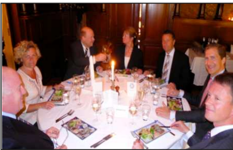
LA PREMIERE TABLE

Cliquez ici pour consulter le texte complet de la Résolution de Stockholm.